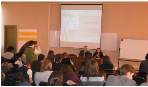
შეხვედრა თავისუფალ უნივერსიტეტში