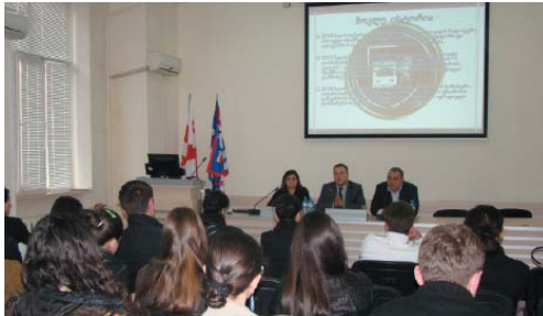
შეხვედრა ილიას უნივერსიტეტში