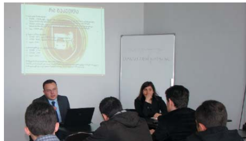
შეხვედრა საქართველოს უნივერსიტეტში