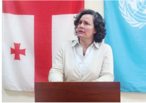
გაეროს განვითარების პროგრამის ევროპისა და დსთ-ის ქვეყნების რეგიონული ბიუროს ხელმძღვანელი, ქალბატონი კორი უდოვიჩიკი

- საქართველო ყურადღების ფოკუსში იმყოფება და ყველა დიდი ინტერესით ადევნებს თვალყურს როგორ მოხდება ძალაუფლების ბალანსი თანამედროვე ხელისუფლებაში. ჩვენ გვჯერა, რომ მთავარი ინგრედიენტი ხელისუფლებისთვისა და სასამართლოსთვისაა არის ადამიანის უფლებების დაცულობის გარანტიების არსებობა. მთავარია დაცული იყოს პირობები, რაზეც თქვენი პარლამენტი