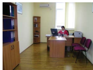
ბიუროს შიდა ქართლში 2009 წლის განმავლობაში აწარმოა 450 სისხლის სამართლის საქმე. მათგან 47 არასრულწლოვანთა უფლებების დაცვის კუთხით. ბიუროს კონსულტანტმა 360 მოქალაქეს გაუწია სამართლებრივი კონსულტაცია, რა დროსაც შედგა 120 სამართლებრივი დოკუმენტი. 2010 წელს ბიუროს ადვოკატები ჩართულნი არიან 125 სისხლის სამართლის საქმეში. კონსულტაციების რაოდენობა კი 108-ს შეადგენს.

იურიდიული დახმარების ბიუროს გორში 2007 წლიდან არსებობს. 2008 წლის რუსეთის აგრესიის შემდეგ ბიუროს მხარს უჭერდა გაეროს განვითარების პროგრამის